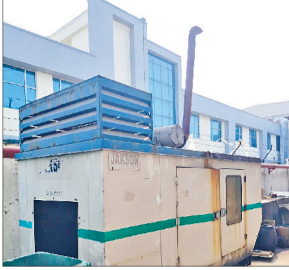
बहादुरगढ़। कार्रवाई के दौरान सील किया गया डीजी सेट।

गैर-अनुपालन की रिपोर्टों पर कार्रवाई करते हुए टीमों ने पर्यावरण मानदंडों के पालन की पुष्टि करने के लिए बरहाणा, बहादुरगढ़, बादली और आसपास के क्षेत्रों के विभिन्न उद्योगों का दौरा किया।