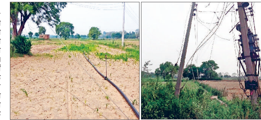
झज्जर। खेत में लगा हुआ ट्रांसफार्मर जहां से टूटी है तारें तथा खेत में टूटी पड़ी बिजली की तार।