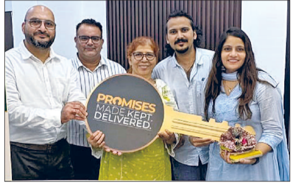
बहादुरगढ़। अपने घर की चाबी प्राप्त करता एक परिवार।

किसानों ने बिजली निगम अधिकारियों व जिला प्रशासन से गुहार लगाई है उनके क्षेत्र में बिजली व्यवस्था सुचारू करके उनकी समस्या का समाधान किया जाए।