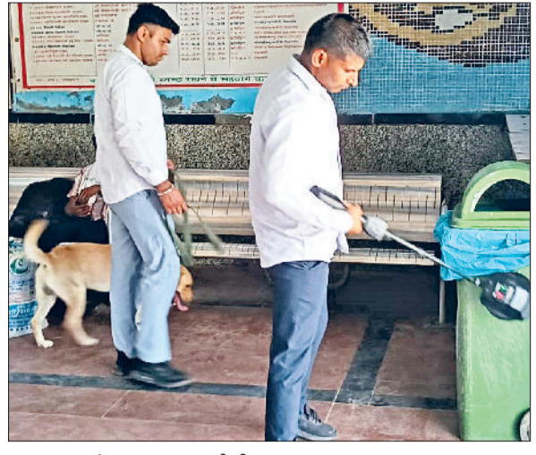
बहादुरगढ़। स्टेशन पर जांच करती टीम।

कर दिया गया। इनके अलावा उर्जा बैटरीज लिमिटेड बहादुरगढ़, बाबाजी उद्योग झज्जर को हरियाणा राज्य प्रदूषण नियंत्रण बोर्ड से आवश्यक स्थापना सहमति (सीटीई) और संचालन सहमति (सीटीओ) प्राप्त किए बिना संचालन करने के चलते सील कर दिया गया है।