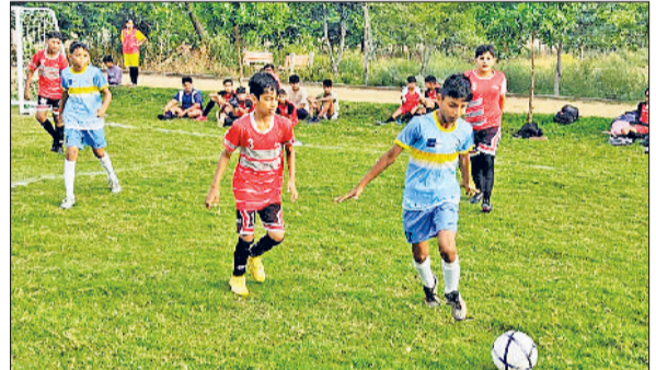
बहादुरगढ़। गोल के लिए फुटबॉल के पीछे दौड़ते खिलाड़ी।

गांव नूना माजरा में लव कुश फुटबॉल लीग का आयोजन जारी है। शुक्रवार को 17 मैच खेले गए। बहादुरगढ़, इंडस, लोवा खुर्द आदि टीमों ने अपने मुकाबले जीते। मैचों का शुभारंभ कोच मंगत राम ने किया। अंडर-10 के पहले मुकाबले में इंडस कोकर ने एलकेएससी स्तर को 5-0 से हराया। दूसरे मुकाबले में इंडस आयरन ने इंडस को 5-3 से हराया। लोवा खुर्द स्पोर्ट्स क्लब ने दुल्हेड़ा पर 3-0 से जीत दर्ज की। सिटी बहादुरगढ़ फुटबॉल क्लब ने भापड़ोदा को 6-1 से शिकस्त दी। इंडस रेपिड ने एलकेएससी स्तर को 3-1 से हराया। अंडर-12 में पहले मुकाबले में लोवा खुर्द-जी ने इंडस काइट को 3-0 से हराया। दूसरे मुकाबले में दुल्हेड़ा ने इंडस को 3-1 से परास्त किया। तीसरे मुकाबले में