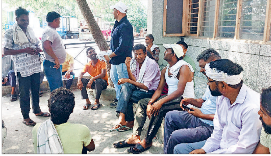
झज्जर। कर्मचारियों को मनाने का प्रयास करते हुए ठेकेदार।

शुक्रवार को ठेकेदार भी पहुंचे कर्मचारियों को मनाने लेकिन नहीं बनी खात