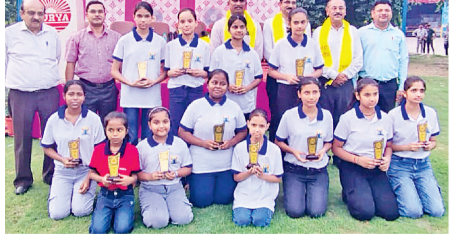
बहादुरगढ़। विजेता प्रतिभागियों के साथ फाउंडेशन के सदस्य व पदाधिकारी।