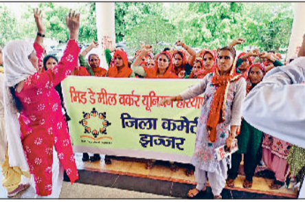
झज्जर। डीईओ कार्यालय के समक्ष नारेबाजी करते हुए मिड-डे-मील वर्कर्स।